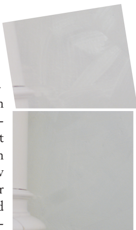
Färgytan kan se flammig ut under oxidationen men jämnar ut sig när färgen oxiderat färdigt